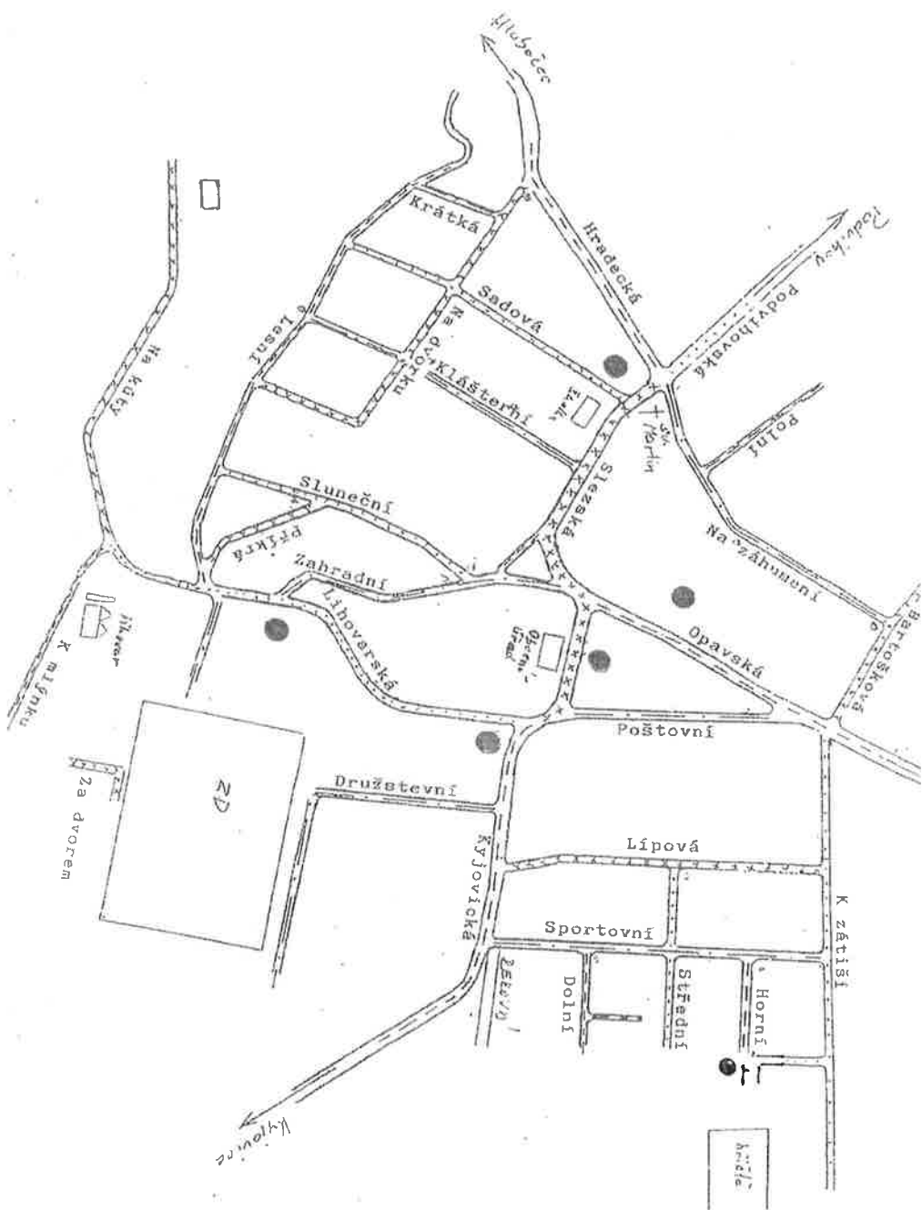
Příloha č. 1 – Umístění zvláštních sběrných nádob na sklo