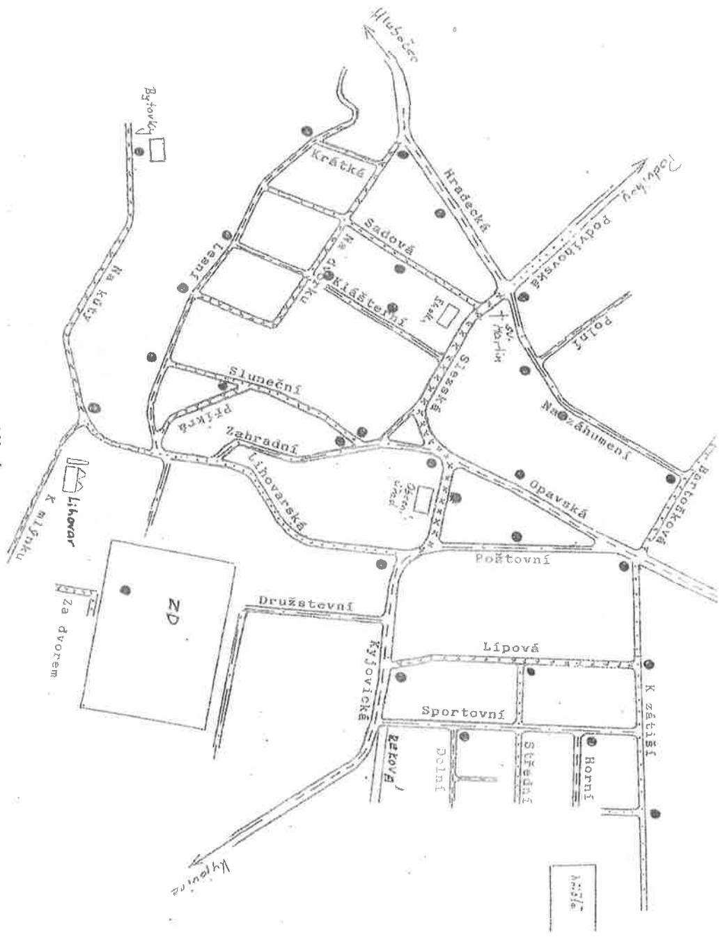
Příloha č. 2 – Sběrná místa pro sběr plastů, včetně PET láhvi a pro nápojové kartony