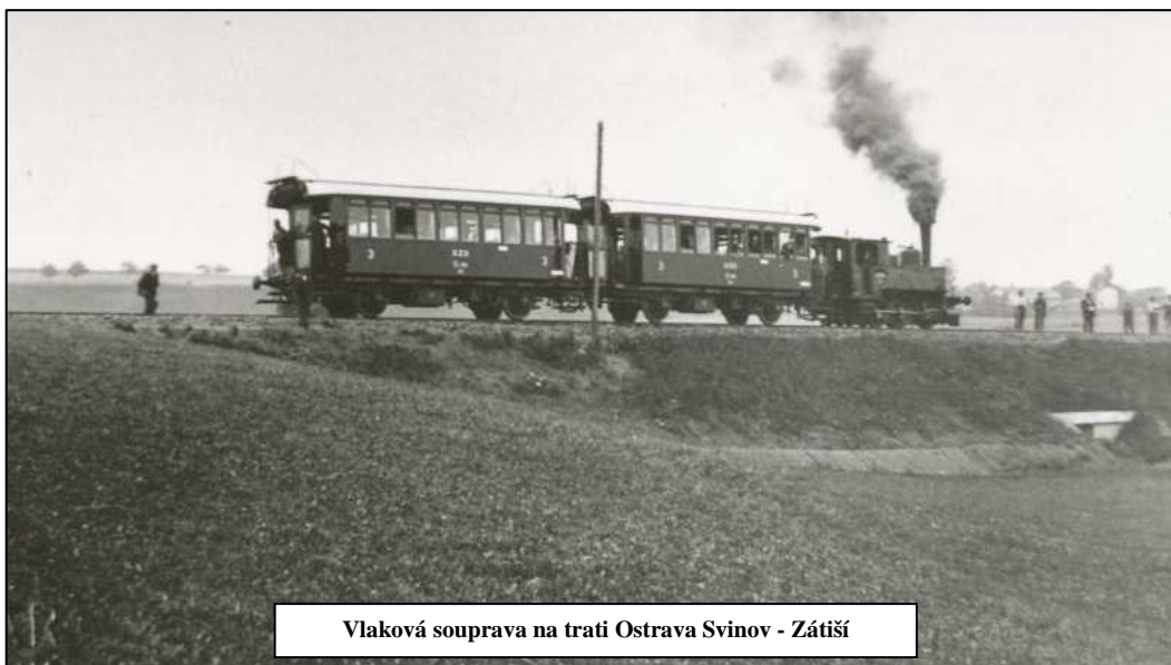
Vlaková souprava na trati Ostrava Svinov - Zátíší

Zajistit obživu pro sebe a rodinu byla starost od pradávna vždy nelehká. Naše obec byla v minulosti především obcí zemědělskou. Avšak klimatické podmínky, nadmořská výška nad 400 m a primitivní hospodaření s velkým podílem ruční práce, poskytovalo většinou jen skromnou obživu. Navíc lidé, kteří nevlástnili ani kousek pole, byli nuceni pracovat „na panském“, u sedláků nebo v lese.